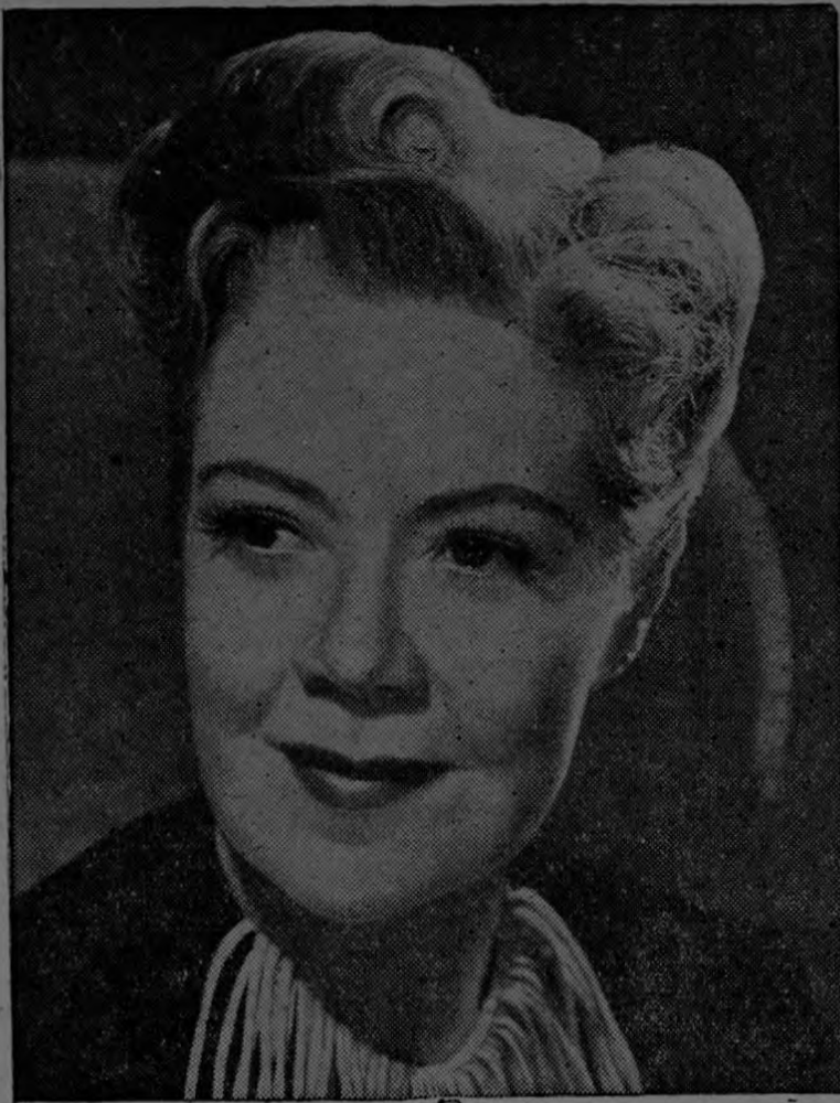
Spring Byington, la actriz tan hábil en el drama como en la comedia, añade otra inolvidable caracterización a su carrera en la nueva película de la Metro-Goldwyn-Mayer. "LA VIDA ES PARA AMAR."

Se toma un pedazo de lomo que pueda ponerse en la parrilla, (instrumento en forma de rejilla para asar) se limpia de grasa y se le hacen unas cortaduras al través, para formarle una especie de bolsitas que se van rellenando con un picadillo hecho con perejil y cebolla picados finísimos, pan rallado también muy fino, mantequilla, sal y jugo de limón. Se toma después el lomo, apretando bien el relleno dentro de él. En caso de que se vea que el relleno amenaza salirse, hay que amarrar la carne con un cordelito. Se le pone entonces un papel estraza enmantequillado y se coloca en la parrilla para que se ase. Se sirve trozado y rodeado de cogollos de lechuga y ruedas de limón.